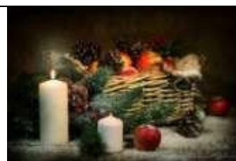
А) Новый год